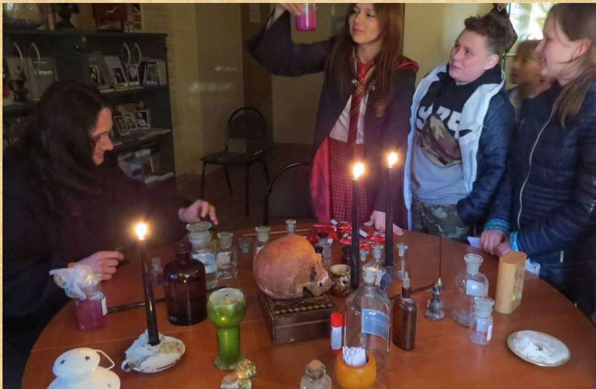
Эксперименты безумного профессора, 1