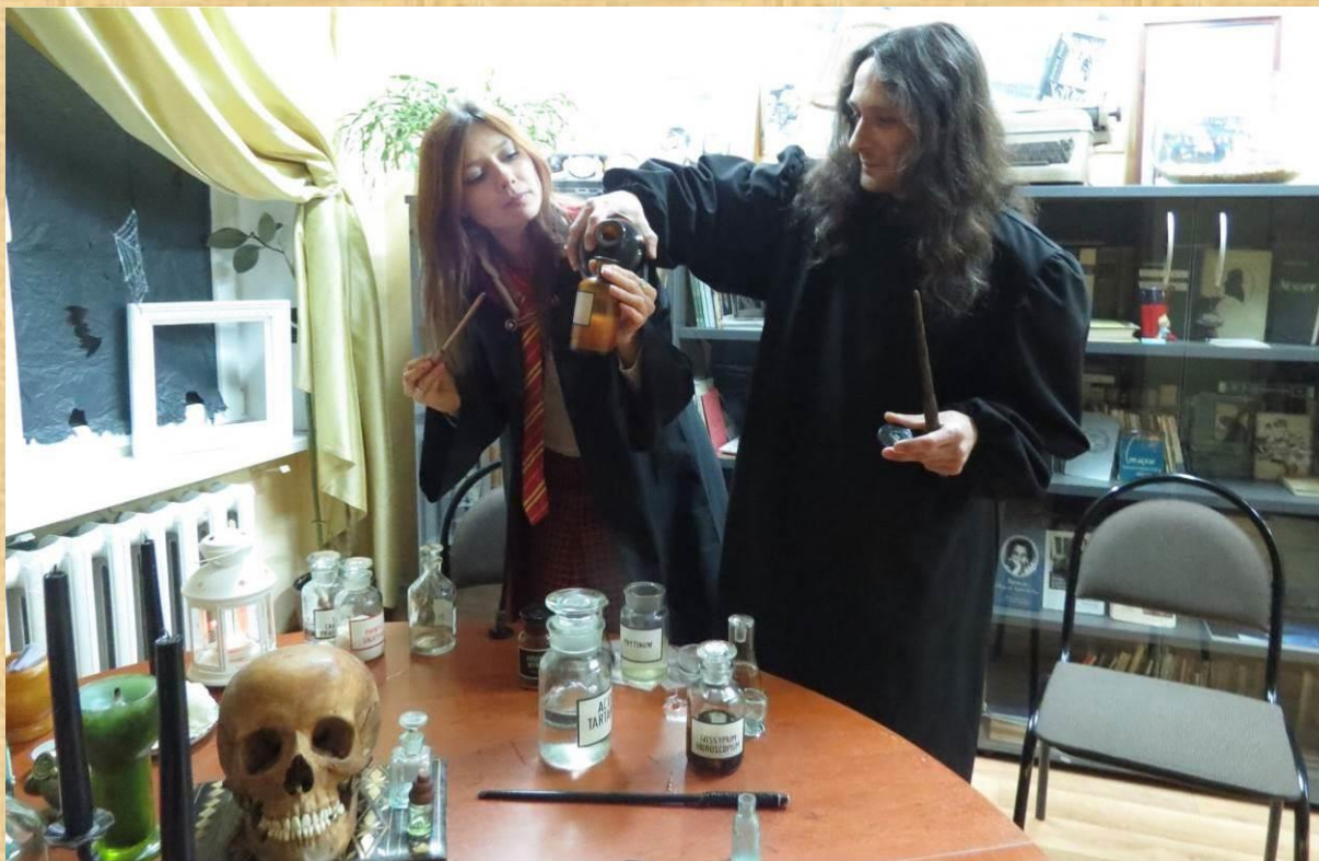
Эксперименты безумного профессора, 2